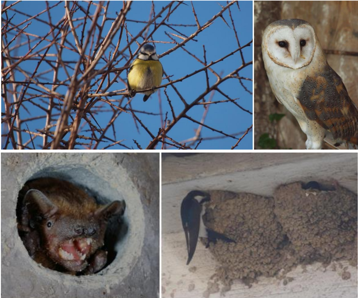
V.l.n.r. obere Reihe: Blaumeise; Schleiereule; untere Reihe: Abendsegler; Mehlschwalbe

Gebäude stellen wichtige Lebens- und Rückzugsräume für verschiedene Tierarten dar. Vor allem Vogel- und Fledermausarten sind in besonderer Weise vom Lebensraum Gebäude abhängig, doch die Wohnungsnot für diese nimmt immer mehr zu. Gebäudesanierungen und Fassadendämmungen tragen zur Verknappung des Wohnraums für die Arten bei. Die Folge, Obdachlosigkeit und Rückgang der betroffenen Tiere bis hin zum Aussterben der Arten. Besonders betroffen sind dabei u.a.: Mehlschwalben, Rauchschwalben, Mauersegler, Spatzen (Haussperlinge), Schleiereulen, Blaumeisen, und Fledermäuse.